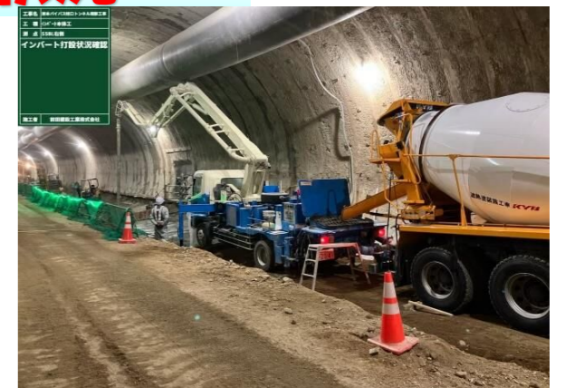
インバートコンクリート打設状況