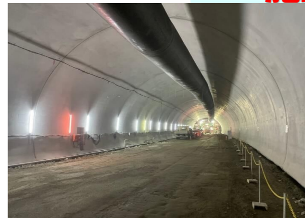
覆工コンクリート完了状況