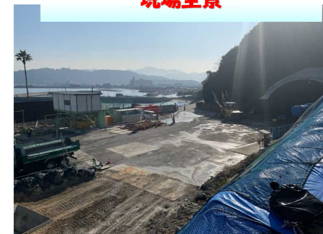
起点側仮設ヤード（坑口側）