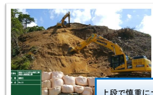
上段で慎重に土砂を掘削し、下段のポケット部に投入しています。