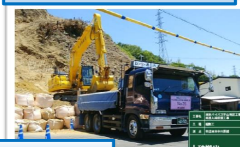
残土の積込状況です。