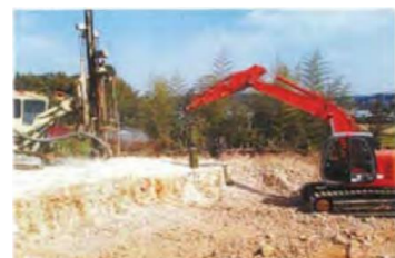
ドリルで岩盤に穴を開けます

※切土部では岩盤を掘削していくことになります。従来のプレーカによる割岩ではなく、より振動を抑えられるビッカー工法で岩盤を割って行きます。