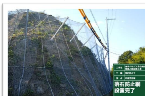
愛宕線部の落石防護が完了しました。