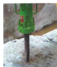
ビッカー(くさび状のセリ矢)を使用して油圧の力で岩を割ります