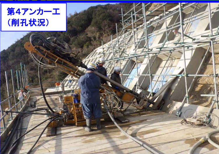
第4アンカー工 (削孔状況)