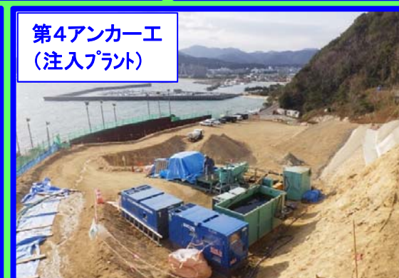
第4アンカー工 (注入プラント)